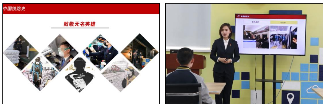
图 2 师生分享抗疫感人故事

运用疫情防控“教科书”挖掘感人铁路故事，家国情怀得以厚植。将抗击新冠肺炎疫情中涌现出的英雄人物融入课堂教学，凸显铁路人在抗“疫”中的担当与责任，引导学生树立“人民铁路为人民”的服务意识和“安全、优质、兴路、强国”的新时代铁路精神，培养学生的奉献意识与担当精神。