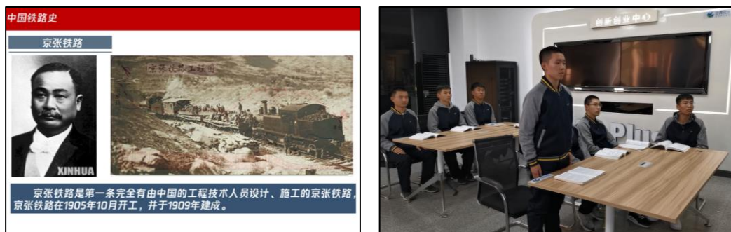
图 4 学生分享中国铁路发展史上的英雄人物事迹

引导学生认识中国铁路发展史上的重要人物，职业使命感得以提升。课前引导学生深入挖掘在中国铁路发展历程中的重要人物，用历史人物的铁路精神、家国情怀，激发学生探索中国铁路的兴趣，树立远大的理想和抱负。