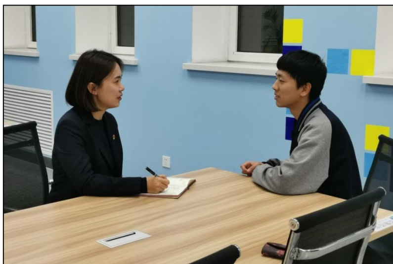
图 6 教师与学生开展主题访谈

以“中国铁路的前世今生”为主题开展访谈活动，围绕中国铁路发展历程中的重要人物、历史事件对学生展开访谈，引导学生树立“爱国报国”的理想，牢固树立为建设中国特色社会主义伟大事业而奋斗终生的坚定信念。