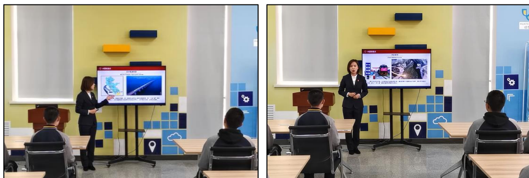
图 5 讲授高铁新技术与“一带一路”发展