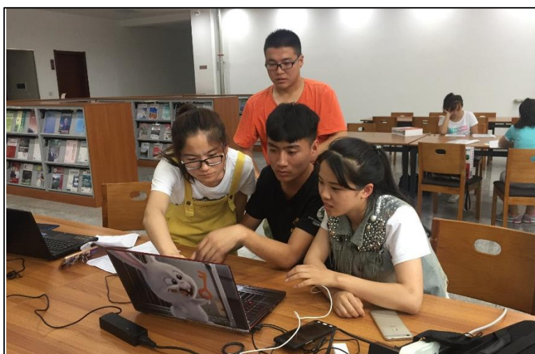
图1 学生课前收集“铁路人”典型事迹

借助《铁道概论》网络学习平台，自主挖掘在中国铁路发展历程中的 重大历史事件 以及在本次抗击新冠肺炎疫情中涌现出的 “铁路人”的典型事迹 ，并在线上与同学、教师展开讨论。